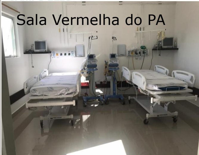
Sala Vermelha do PA