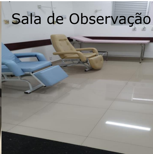
Sala de Observação